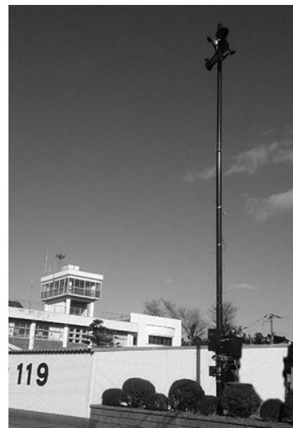
屋外拡声子局施工事例